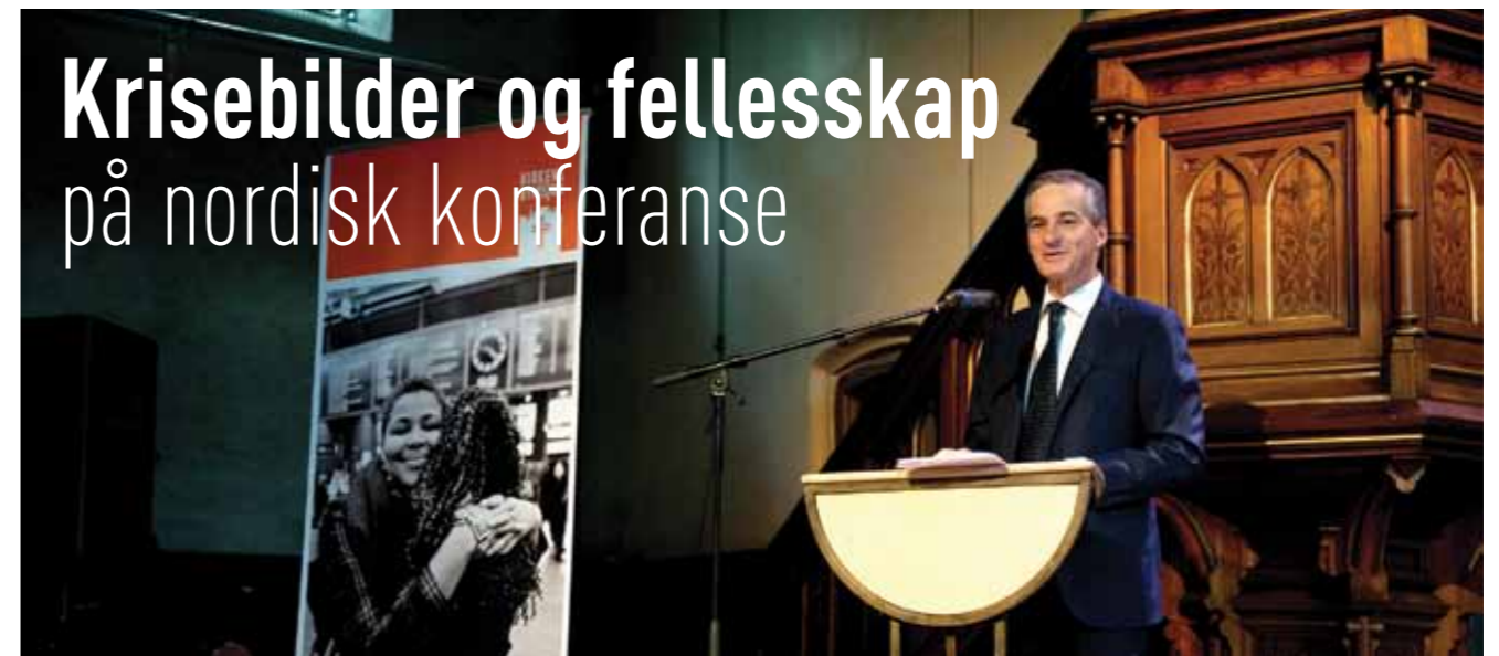
– Det er viktig å fange opp et krisesignal før krisen rammer. Kirkelige og humanitære organisasjoner har et verdigrunnlag som gjør det mulig å avdekke slike tendenser, sa utenriksminister Jonas Gahr Støre til deltagerne på den Nordiske bymisjonskonferansen.