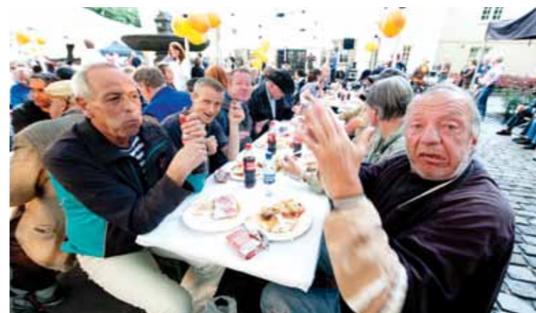
Helgrillet lam og grillet laks smakte fortreffelig.