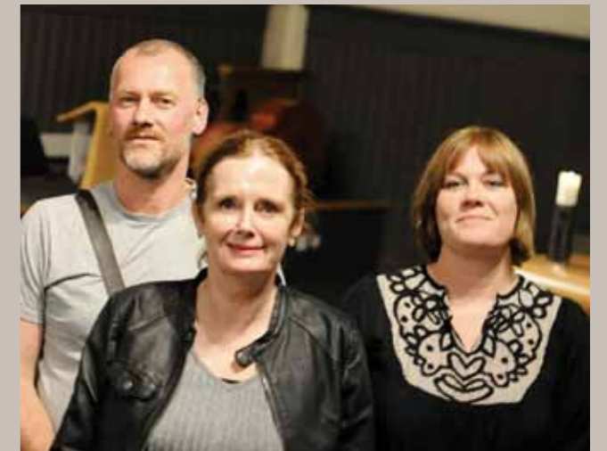
«Natta, mamma» formidler at vi ikke må være likegyldige til hverandres valg.