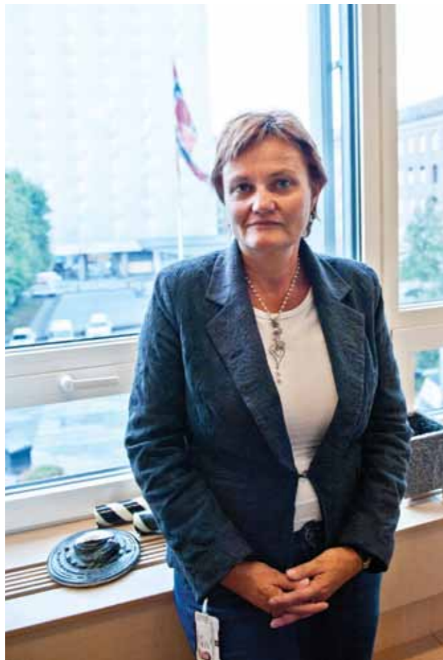
Fra sitt kontorvindu ser statsråd Rigmor Aasrud ut på det ødelagte regjeringskvartalet – og rosebedet som gir håpstanke.

Ministeren skal videre i en travel dag. Enda en gang kikker vi ut på det splintrede bildet med skader og ødelegelser i regjeringskvartalet.