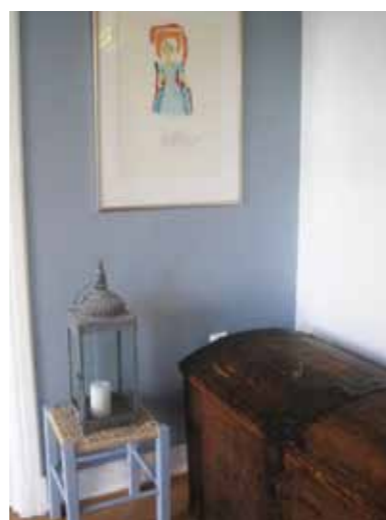
To studenter fra Kunsthøyskolen pusser opp Natthjemmet for kvinner, se side 8–9.