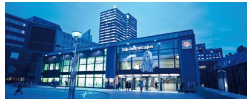
150 000 mennesker er innom Oslo S hver dag. Nå skal Bymisjonen starte et sosialt prosjekt på stasjonen.