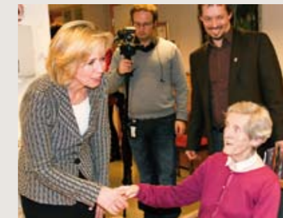
Helse- og omsorgsminister Anne-Grete Strøm-Erichsen møtte deltakere i dagsenteret ved Vålerengen Bo- og servicesenter og fikk innblikk i både bakeaktiviteter, bingo, kulturliv og sosialt fellesskap ved senteret.

Anne-Grete Strøm-Erichsen besøkte nylig Kirkens Bymisjon for å få et innblikk i organisasjonens arbeid innen eldreomsorg og rusomsorg. Besøket ble lagt til Vålerenga, der Strøm-Erichsen snakket med både ansatte og beboere på sykehjemmet Vålerengen bo- og servicesenter og Kirkens Bymisjon Enga, omsorgsinstitusjonen for personer med langvarig rusavhengighet. Samtalene handlet blant annet om framtiden for ideelle aktører i helse- og omsorgssektoren, og pasientrettigheter, tjenestetilbud og samhandling mellom ulike aktører i russektoren. Statsråden ble presentert for nye prosjekter og arbeidsformer på eldresektoren, og lyttet aktivt til gode råd om offentlig ansvar og koordinering av tjenester blant unge mennesker med rusavhengighet.