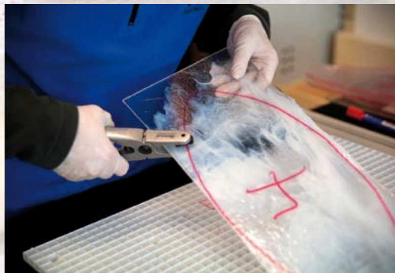
Glasset brekkes av.