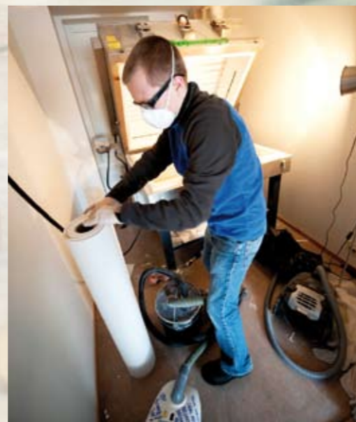
Smelteovnen gjøres klar.