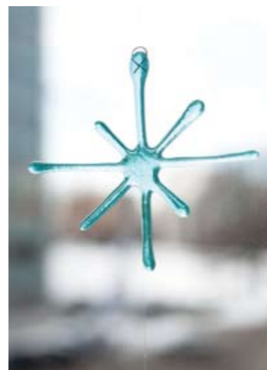
Glasskunst fra Unikum-verkstedet. Les mer om «Kreativt Unikum» på sidene 15-17.