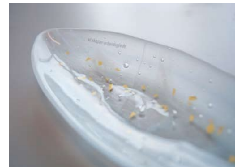
Et ferdig glassfat.

Trygve viser gjerne hele prosessen fra ruglete glass som skjæres ut i ovale former, til sliping, vasking, dekorpålegg og første brenning i smelteovnen.