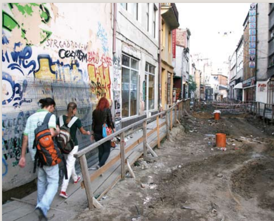
Bykmisjonsreisen til Romania var et møte med både moderne bykultur og fattigdom.

virksomheten som skjer. I europeisk målestokk er Romania et land med stor fattigdom. Særlig utsatt er deler av rom-befolkningen. På studiereisen besøkte bymisjonsrepresentanter lokalsamfunn med en fattigdom som var så åpenbar og påtrengende at det er vanskelig å finne lignende i Europa. Manglende skolegang resulterer i analfabetisme. Mangel på grunnleggende infrastruktur som rent vann, elektrisitet og kloakksystem, uttrykker en form for utestenging som er dramatisk og sjokkerende. Det er ikke vanskelig å forstå at mange reiser til vesteuropeiske land for å prøve å komme ut av fattigdommen. Samtidig gjør fattigdommen mennesker sårbare for utnyttning og menneskehandel.