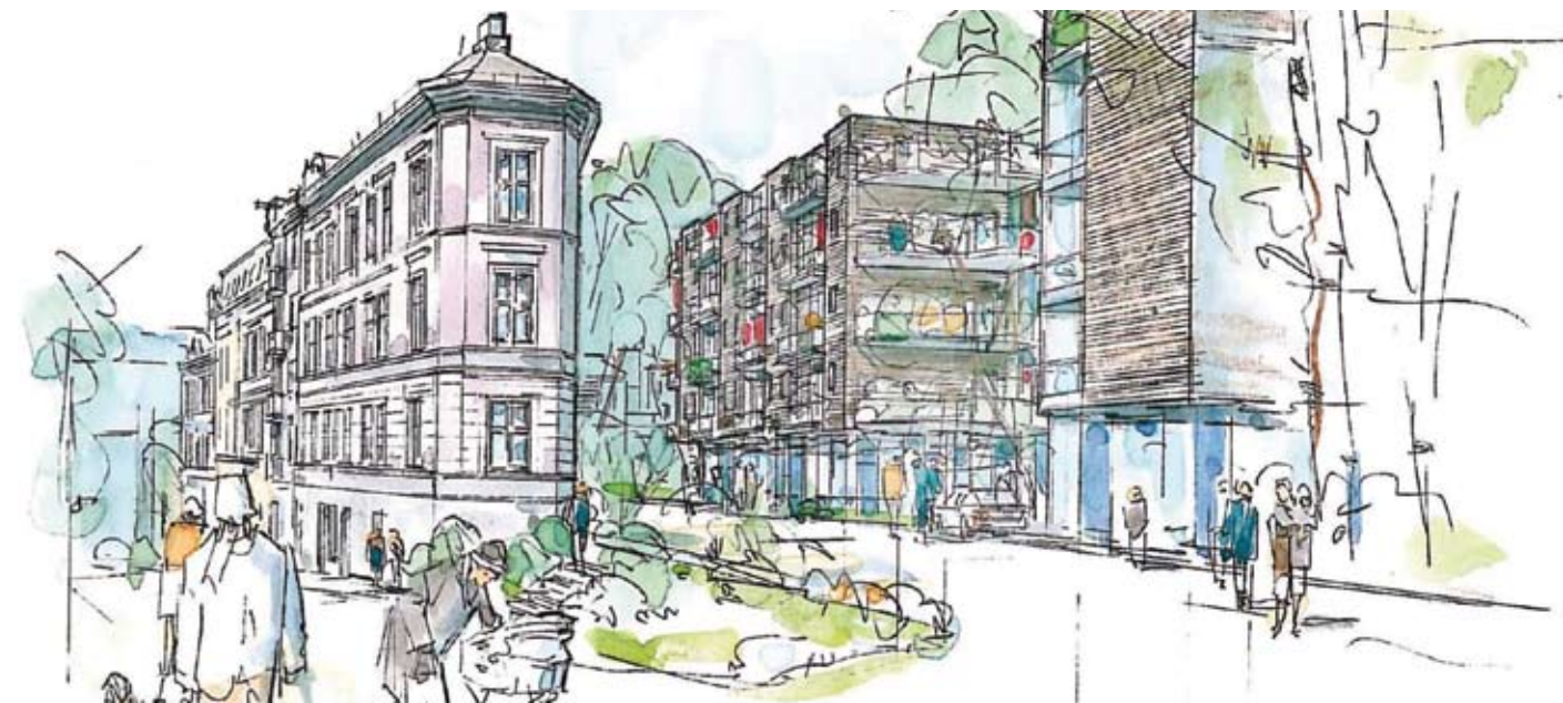
Slik blir det nye Omsorg + på Kampen. Et moderne bosenter for eldre, med store felles-arealer ut mot nærmiljøet.