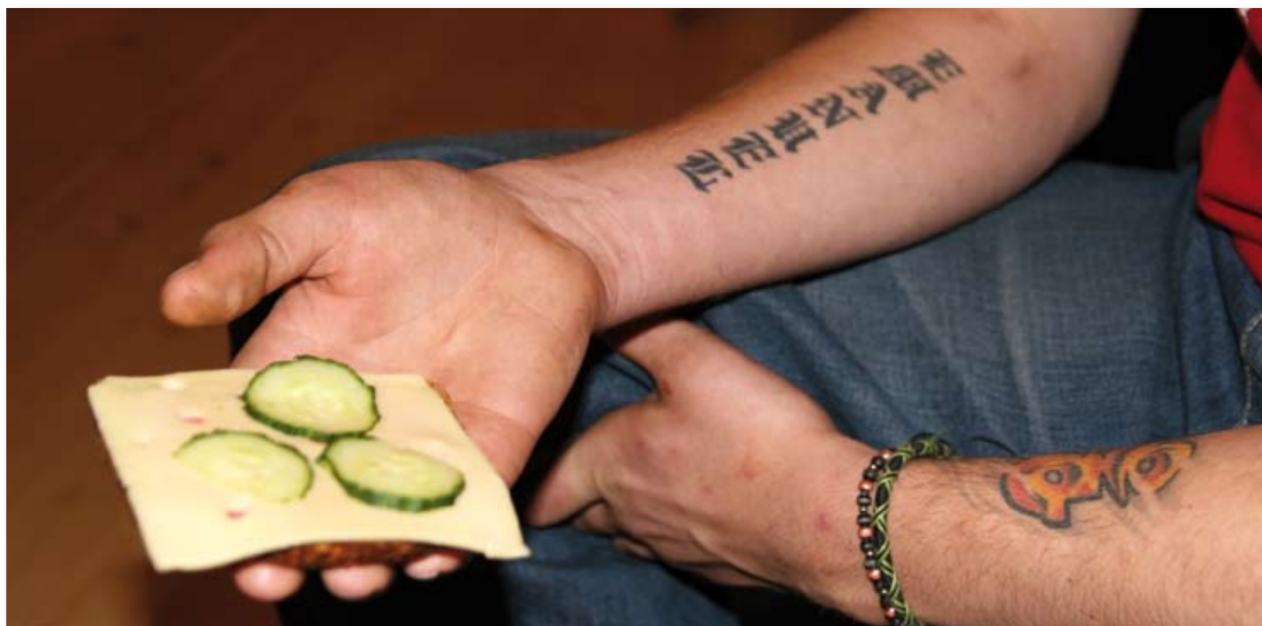
Ro og hvile på 24SJU. Godt med en brødslice til nattmat når man ikke har spist på flere dager.