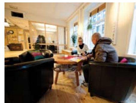
Lav terskel og høy kompetanse er stikkord for det nye tilbudet for rusmiljøet i Oslo sentrum.