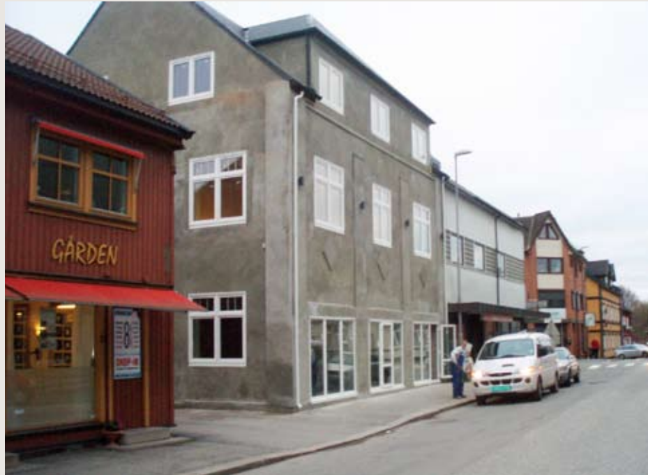
I den gamle Joneidgården i Sarpsborg skal deltakerne få verdifull arbeidstrening gjennom å restaurere og selge gamle møbler.