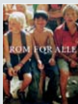
Bok: Rom for alle – én bok om det å være menneske "Det dypeste menneskelige fellesskapet, det er våre skavanker, og alle kan bidra med det. Hvis vi kan bli flinkere til å omfavne det hos hverandre, da får vi det bedre. For fasader, det er det bare noen som kan lage seg. Skavanker har vi alle." Pris kr. 200,-