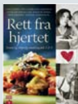
Bok: Rett fra hjertet "Enkelt, billig og godt- og med bidrag fra både mesterkokker og bymisjonskokker. Fordi vi vil vise at det beste kan være enkelt, og at måltidet blir best når det serveres Rett fra hjertet." Pris kr. 200,-