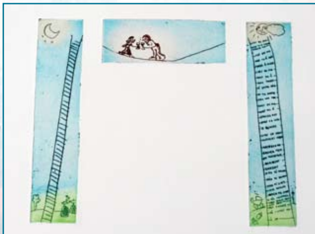
Thorhallsdottirs "Livets balansegang" ble virkeliggjort under arrangementet "Hjertefred" ved at en linedanser gikk over Sandvikselva mens hun fremførte budskapet i bildet.