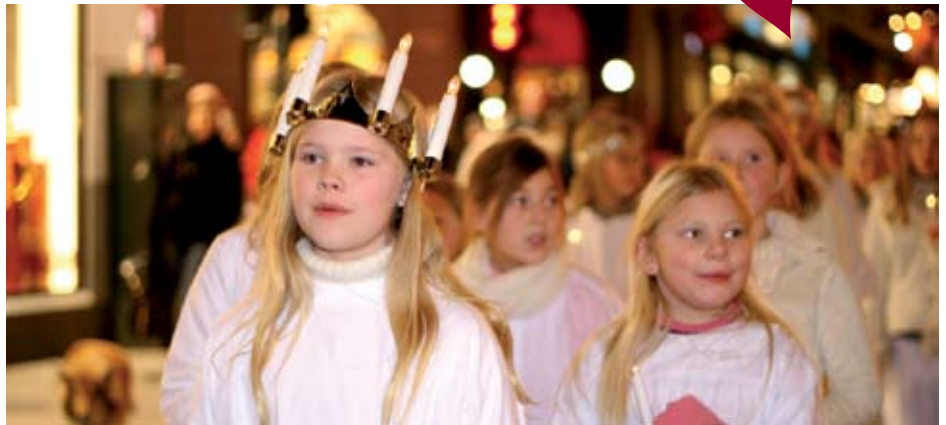
Luciatoget ned Karl Johans gate er starten på en rekke bymisjonsarrangementer i tida fram til jul.