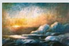
Julekort nr. 3 Kunstner: Lind-Arnold Solstad Tittel: Blå aften Teknikk: Lito