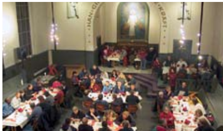
Gjestebud i Tøyenkirken

Når Lys i Mørket-aksjonen arrangeres, er det mange faktorer som skal på plass. Til en julaftenfeiring på Bymisjonssenteret er det behov for middag, dessert, kaffe og kaker til ca 150 mennesker. Juletreet skal pyntes og bordene likeså. Vakker julestemning lages med levende lys, julens blomster, fyr på peisen og deilig duft av røkelse. Mat og julepynt blir hvert år gitt av næringslivet, og en gjeng frivillige sørger for at alt blir tatt hånd om på beste måte. Julaftenfeiringen på Bymisjonssenteret er tradisjonsrik og stemningsfull, og danner rammen rundt gode møter mellom menneskene som feirer høytiden der.