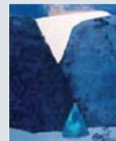
Julekort nr. 8 Kunstner: Ståle Blæsterdalen Tittel: På den 7. dag Teknikk: Tresnitt