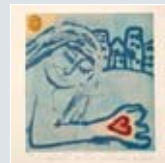
Julekort nr. 4 Kunstner: Ebjørg Thorhallsdottir Tittel: Med hjertet i hånden Teknikk: Lito