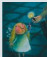
Julekort nr. 7 Kunstner: Eldbjørg Ribe Tittel: Engel med lys