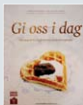
Bok: Gi oss i dag Brød er livsviktig. Det er fest også! Det gjelder oss alle - uansett hvem vi er. Gi oss i dag består blant annet av franske spesialiteter fra Åpent Bakeri, sunne saker fra Godt Brød og trondheims spesialiteter fra Erichsens konditori. Pris kr. 339,-