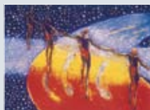
Julekort nr. 2 Kunstner: Frans Widerberg Tittel: Himmelfall Teknikk: Lito