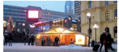
Betlehemsstallen på torget er samlingssted for mange i dagene før jul.

Gjestebudene har lang tradisjon i Kirkens Bymisjon, og hvert år inviteres beboere på hospitser og hybelhus til en stor middag som sponses av Rica Helsefy. Da er det selve kirkerommet som pyntes av de frivillige medhjelperne, og hele middagen er lagt opp som en helt spesiell gudstjeneste. Når gjestene utpå kvelden går hver til sitt, får de med seg en rød rose på veien. Det er Ragnar Svingningen AS som sørger for å gjøre en slik gest mulig, og firmaet