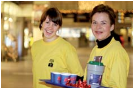
Aksjonsdag på Oslo S

Det er mange som vil være med og gi gjestene våre en god jul. Hvert år kontakter vi næringslivet i byen og spør om de kan tenke seg å stille med varer og tjenester vi trenger til Lys i Mørket-aksjonen. Og får de ikke telefon fra oss raskt nok, ringer de selv og ber om å få hjelpe til!