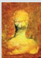
Julekort nr. 5 Kunstner: Nicolaus Widerberg Tittel: Head 1 Teknikk: Olje på lerret