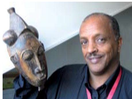
Prosjektet "masker" på Aksept handler både om åpenhet - og om å knytte nettverk

- Nordmenn kan være litt vanskelig å få kontakt med. Du kan ha det hyggelig på pub med noen én kveld, og neste dag blir du ikke gjenkjent av sammen person hvis dere treffes på gata! Men når du får god kontakt med nordmenn kan vennskapet være dypt som en norsk fjord.