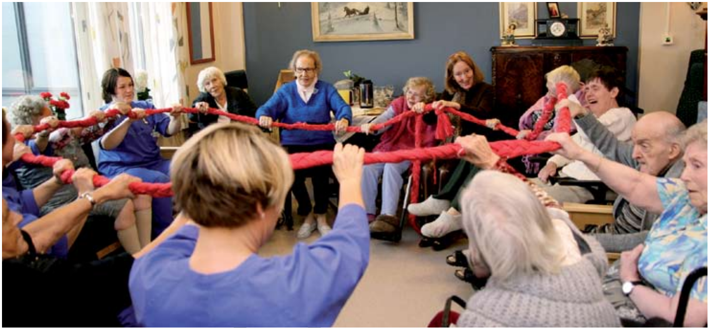
Det flettede tauet "Danse-Lars" binder ringen sammen til et rytmisk, bølgende fellesskap.