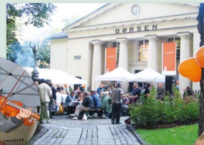
Valkyrien Allstars spilte for et entusiastisk publikum.

Over 300 gjester koste seg på Oslo Børs da næringslivet og Kirkens Bymisjon arrangerte grillfest for rusavhengige.