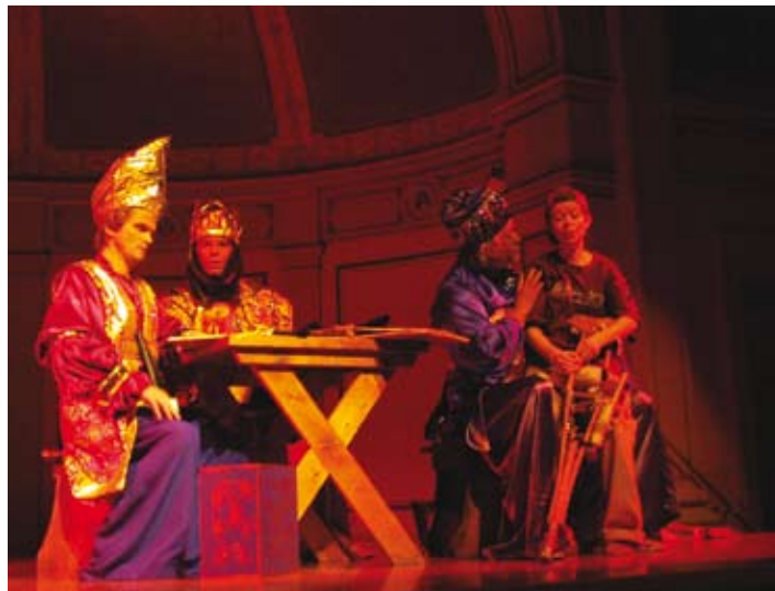
Årets adventskonsert er en ønskereprise av den svært vellykkede og gripende oppsetningen fra noen år tilbake om "Amahl og de hellige tre konger".

Bestill billetter hos Billettservice på telefonnr. 815 33 133, eller direkte hos Gamle Logen på telefonnr. 22 33 44 70.