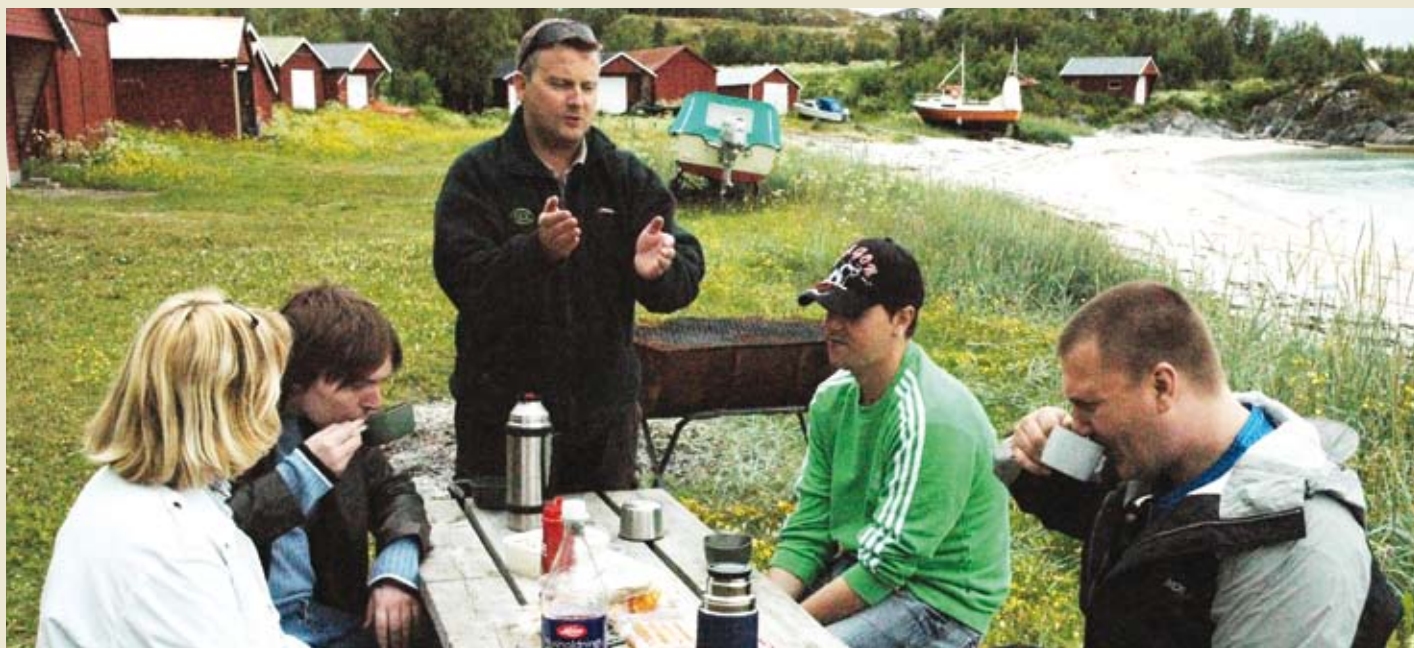
I juni reiste beboere og ansatte fra hybelhuset J49 til idylliske Kjerringøy. I Tårnvika ble det tid til grilling av pølser og en kaffetår.

At frokosten er dagens viktigste måltid, har Kirkens Bymisjon i Bodø tatt på alvor: Hver morgen møtes beboerne på hybelhuset "J49" til en god og næringsrik frokost mens de planlegger dagens gjøremål. Prosjektet kalles de "God morgen – God dag".