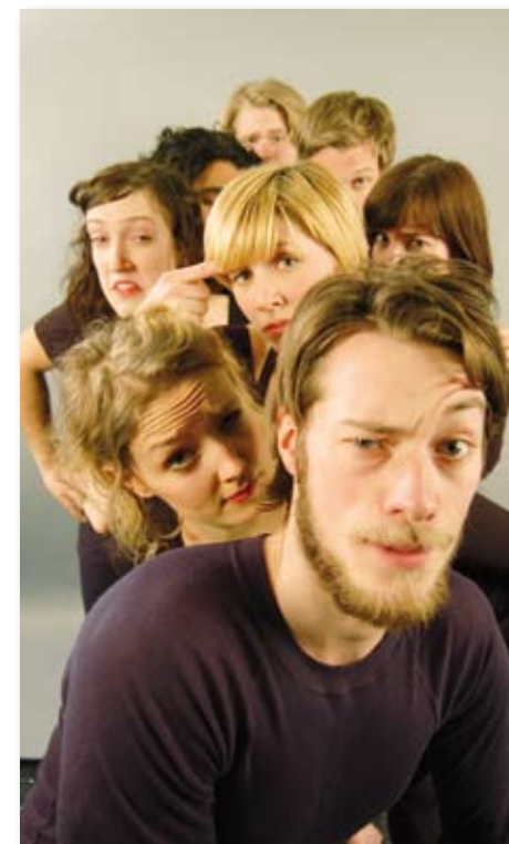
Teaterstudentene synes historien om Robin Hood passer godt til Kirkens Bymisjons arbeid.

En av forestillingene vil gå uavkortet til Kirkens Bymisjons arbeid blant barn og unge. På denne forestillingen vil tilskuerne selv få bestemme prisen på billetten.