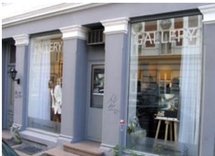
Midt på Grünerløkka: Kirkwood.no Gallery, med kunst til inntekt for Kirkens Bymisjon.