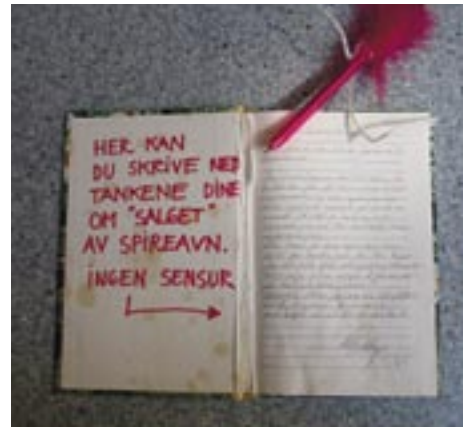
Her kan beboere skrive det de har på hjertet om Bymisjonens farvel til hybelhuset.