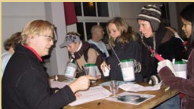
TV-aksjonen var et hovedinnslag i et begivenhetsrikt år for Kirkens Bymisjon i Oslo.

Kirkens Bymisjon i Oslo har ved årsskiftet ca 1200 ansatte og 1100 frivillige medarbeidere.