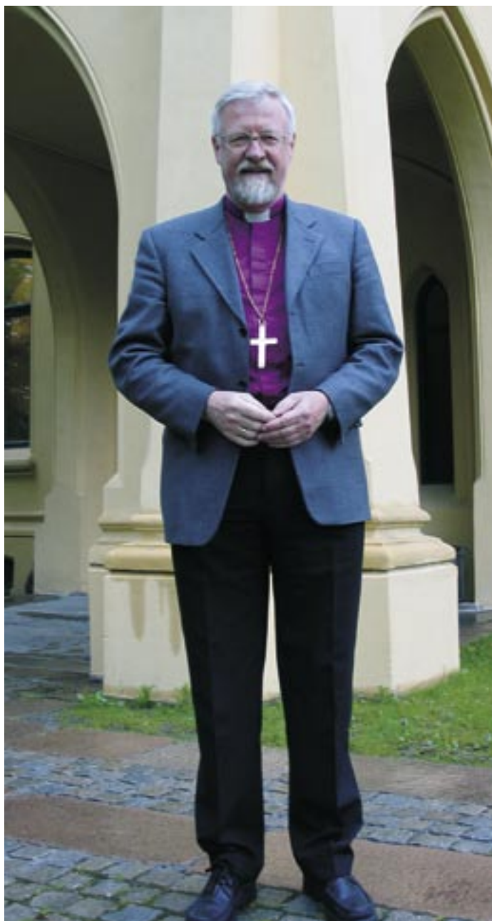
Etter syv år som biskop i Borg, er nå Kvarme biskop for bispedømmet som omfatter Oslo, Asker og Bærum.

representanter for organisasjoner, men som enkeltpersoner.