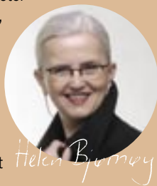
Helen Bjørnøy generalsekretær