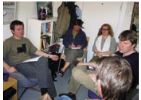
Ledelsen i viktig avviklingsmøte: Hva gjør vi for dem som fortsatt trenger oppfølging?