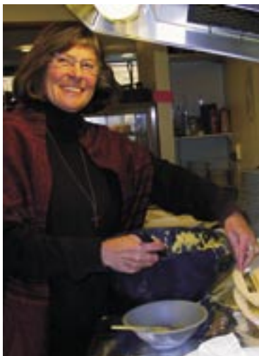
En sosionom er også god ved vaffeljernet...

Kafélokalet, med navnet Møtestedet festet på vinduene, er møblert med brune bord og stoler. Mot en vegg står en like brun bokhylle med noen bøker i, og noen spill. Ved et bord sitter et par av gjestene og blar i dagens aviser. De fleste spiser