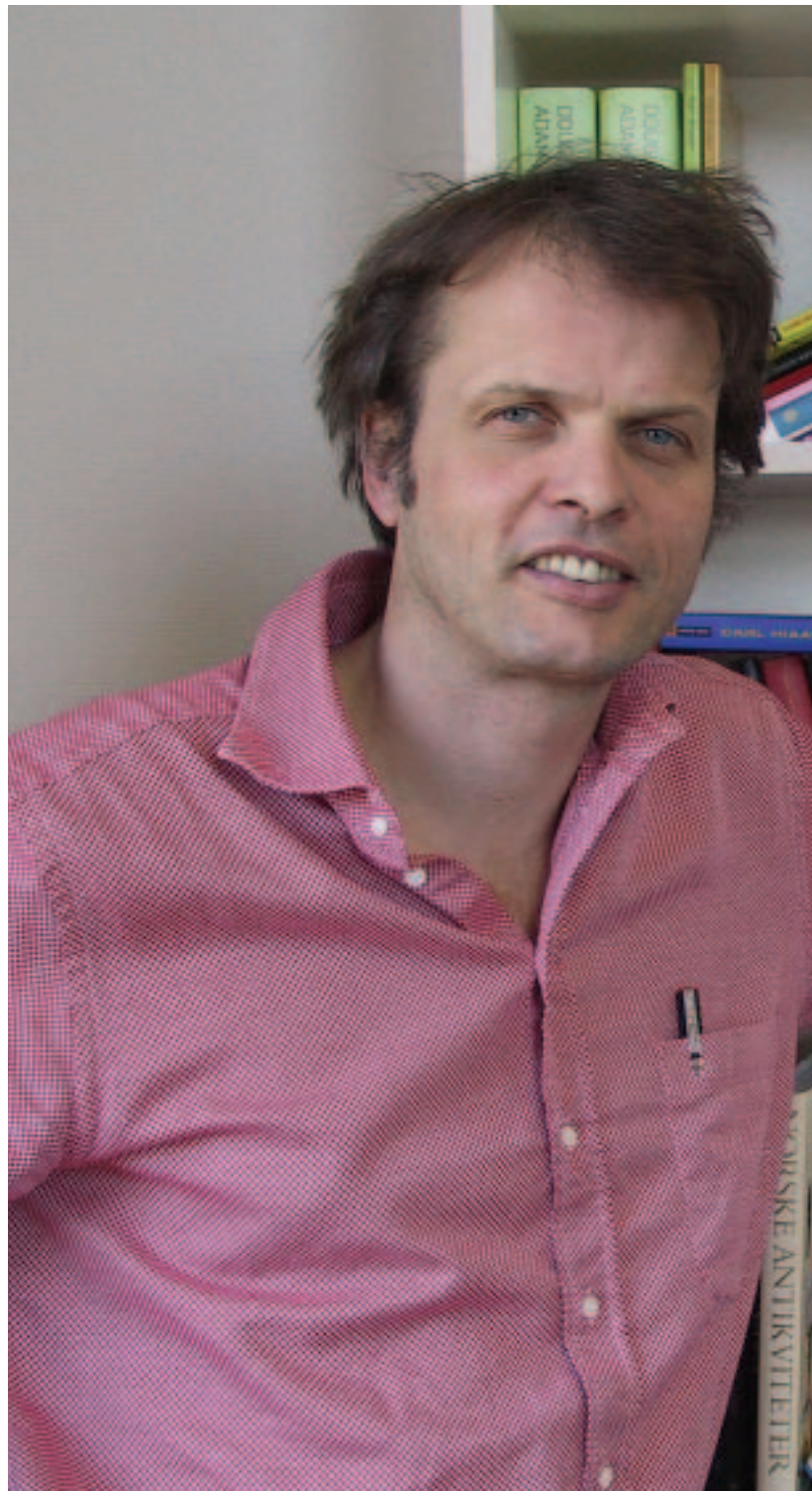
Forlagssjef, eventyrer og bymisjonsvenn: Erling Kagge.

- Vi har forskjellige typer byrder, jeg vil ikke sammenligne meg for mye med dem, men jeg møter noe kjent i det miljøet. Jeg vil helst klatre hvis jeg skal tøye egne grenser. Ikke fryse i gatene. Men jeg kjenner igjen utholdenheten.