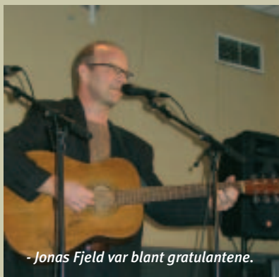
- Jonas Fjeld var blant gratulantene.