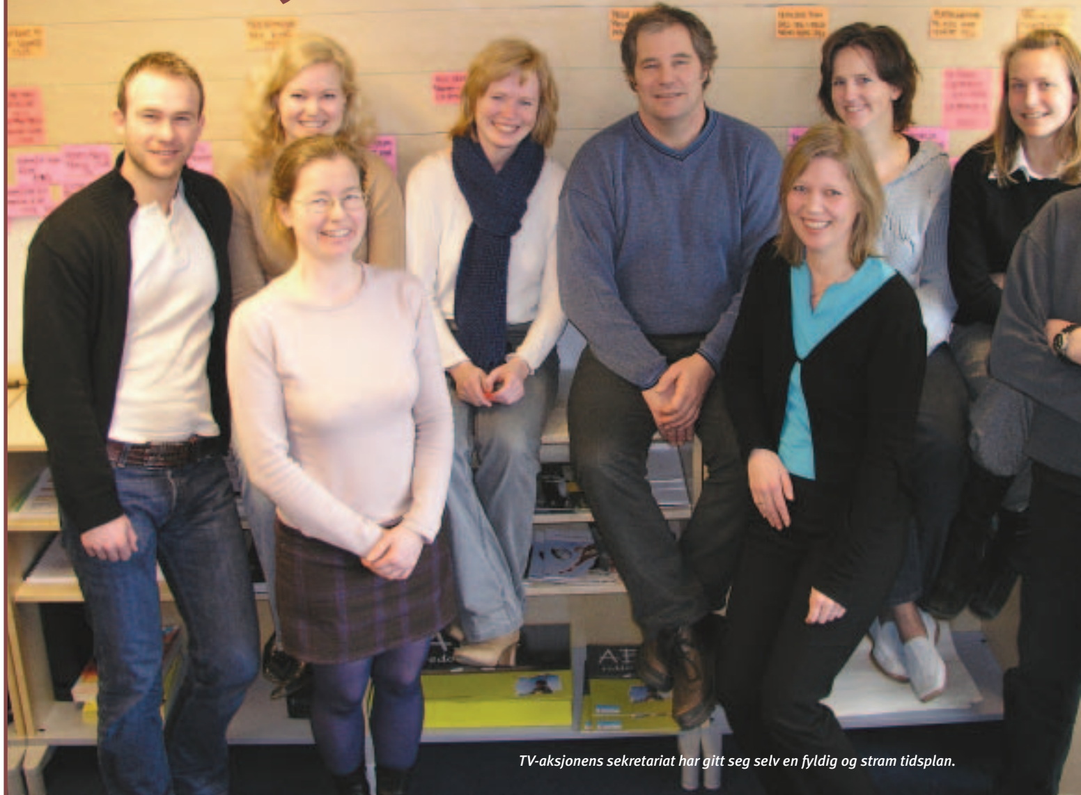
TV-aksjonens sekretariat har gitt seg selv en fylldig og stram tidsplan.

For mange er TV-aksjonen en sending på en søndag i oktober og besøk av bøssebærer på døren. Men for ti av oss er TV-aksjonen Hjerterom en fulltidsjobb preget av stort engasjement, latter, frustrasjon og kreativitet – hele tiden med vissheten om at vi jobber for landets viktigste sak – og med fornyet erkjennelse av at Ingen er bare det du ser.