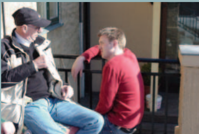
Vår på verandaen i Holmenveien 7. God kontakt mellom beboer og ansatt.

Etter ei voldsom fyllekule, etter nok et nederlag, hva gjør man? Skammen over å svikte igjen, økonomisk ruin, nerver på høykant?