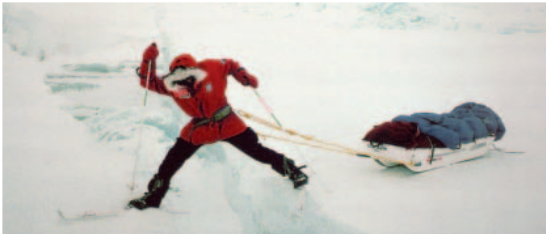
Erling Kagge vet mer enn mange om hva det vil si å krysse avgrunner. Fra Nordpolekspedisjonen i 1990.