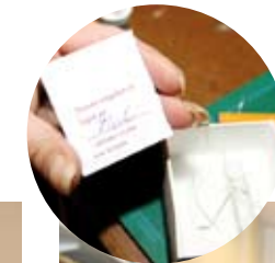
Hver engel legges i en lekker, liten boks sammen med et kort som signeres av personen som har laget den.