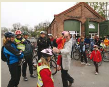
Mange syklister hadde møtt frem for å få med seg åpningen av stallen.

I tilknytning til Sykkelstallen åpnet Kirkens Bymisjon i Fredrikstad også sykkelverkstedet "Pedalen" som skal være et arbeidstrening- og livskvalitetstilbud for utsatte grupper i byen. Gjennom å reparere sykler for kunder og arrangerer turer og aktiviteter håper Kirkens Bymisjon å skape et godt miljø for mennesker som trenger å få mot og erfaring til å stå i en arbeidsrelasjon. Med sin miljømessige og sosialfaglige profil er tiltaket midt i blinken for miljøvernminister Bjørnøy.