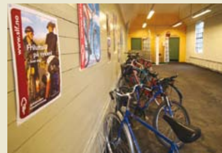
Sykkelstallen tilbyr reisende trygg oppbevaring, omkleddingsrom og sykkelvask.

- Dette er et pionerprosjekt som har god forankring både i Fredrikstad kommune og hos brukerne. Derfor er det spesielt hyggelig å se at midlene blir brukt på best mulig måte og at de kan gi et lite puff til personer som ønsker å komme videre i livet, sa hun.