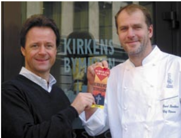
Kiwi og Pascal bidro til fjorårets kampanje.

I konvolutten ligger et brev, en giro og en oblat som skal klistres opp på inngangsdøren til butikken. Oblaten har påskriften "Vi bryr oss om Oslo", Kirkens Bymisjons logo og årstall. Butikken betaler 1500 kroner for oblaten, og inntektene går til arbeidet blant hjemløse og rusbrukere.