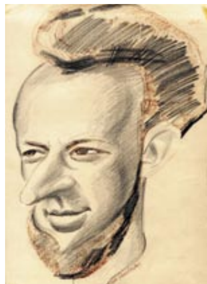
Tegning: Tom Gundersen 1977

- Du overtok en organisasjon med 10 institusjoner. Nå har bymisjonen i Oslo