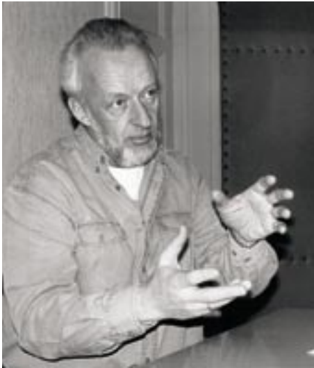
Profilert og dynamisk organisasjonsleder gjennom mer enn to tiår.