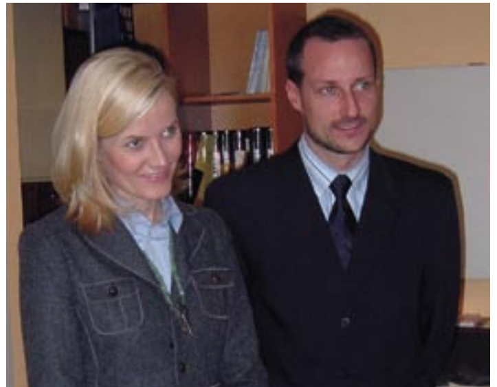
Kronprinsparet. Kronprinsen roste arbeidet som blir gjort ved Aksept og er glad for kunnskapen de har fått om og på stedet.

NIK-kontrollerte innsamlingskonti: Post- og bankgiro 105 eller 7011 05 18