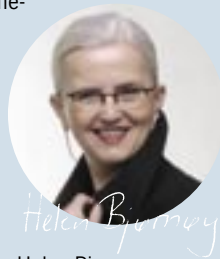
Helen Bjørnøy generalsekretær

Menneskets higen etter å undertrykke hverandre har alltid vært en fristelse for menneskeheten. Kirken må være en aktør som er opptatt av makt og maktforvaltning – både innenfor kirken og i samfunnet for øvrig. Det er først da vi kan være en sann kirke for alle.