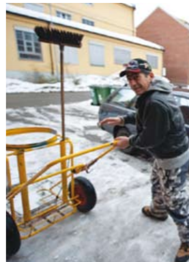
Hamlet er i ferd med å forberede dagens ryddeøkt i Lillestrøm sentrum. Les om Arbeidslinja på sidene 15–17