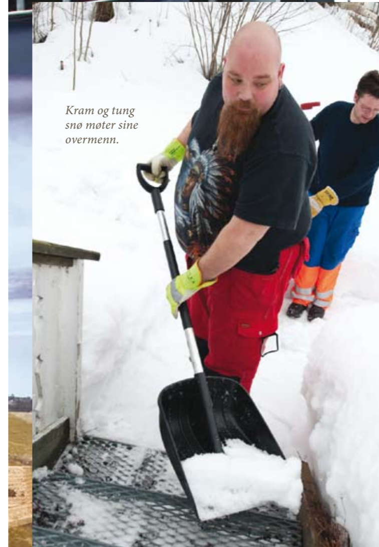
Kram og tung snø møter sine overmenn.