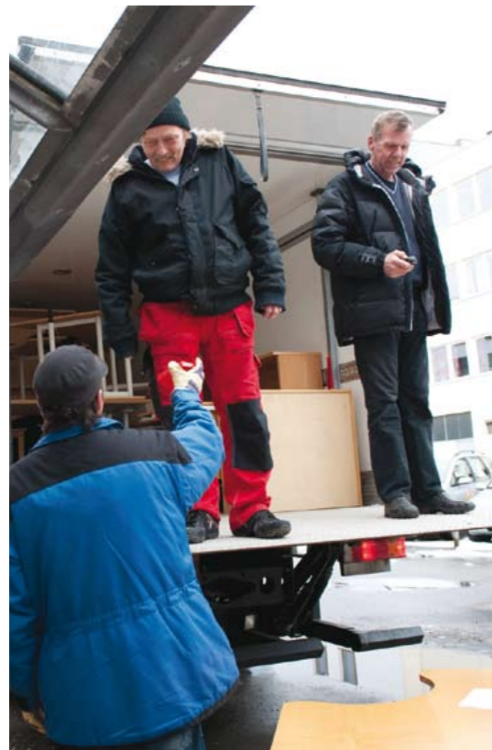
Kontormøbler skal på plass i Helsbyggs nye lokaler.