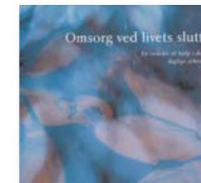
Omsorg ved livets slutt – en veileder til hjelp i det daglige arbeidet.