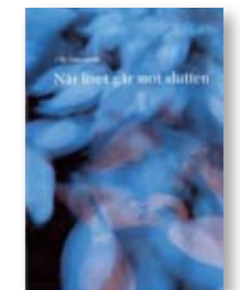
Når livet går mot slutten. Av Ulla Söderström.