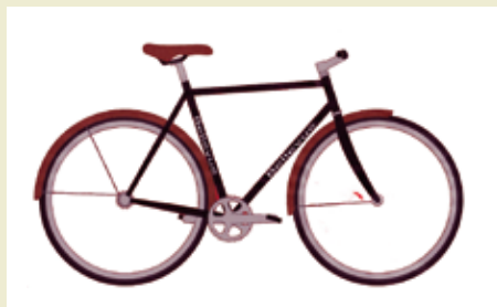
Klassisk, stilig og god kvalitet. Omtrent slik ønsker Leiro at sykkelen skal se ut. Tegning: Rasmus Leiro.