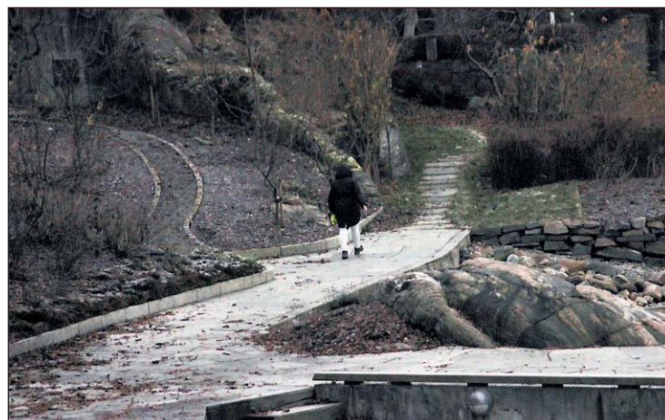
Det er ennå ikke endelig avgjort om folk kan ferdes fritt i framtiden på den hellelagte kyststien på Ilaveien 24 og 28 på Fjellstrand.