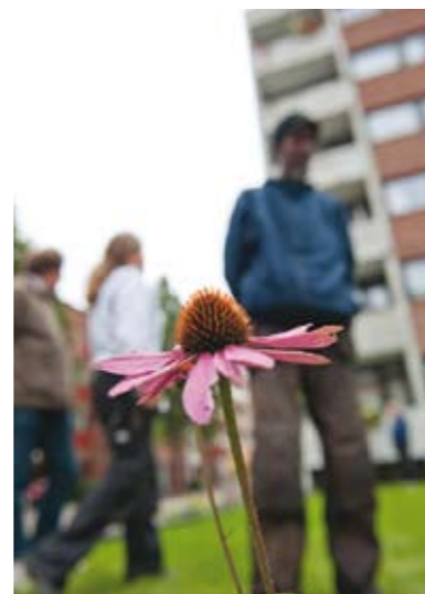
På sidene 15-17 viser vi litt av hverdagen til «bygartnergruppa».