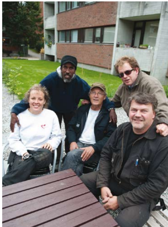
Fire dager i uka tar bygartnerne oppdrag rundt omkring i byen. Gruppen er blitt en sammensveiset gjeng.